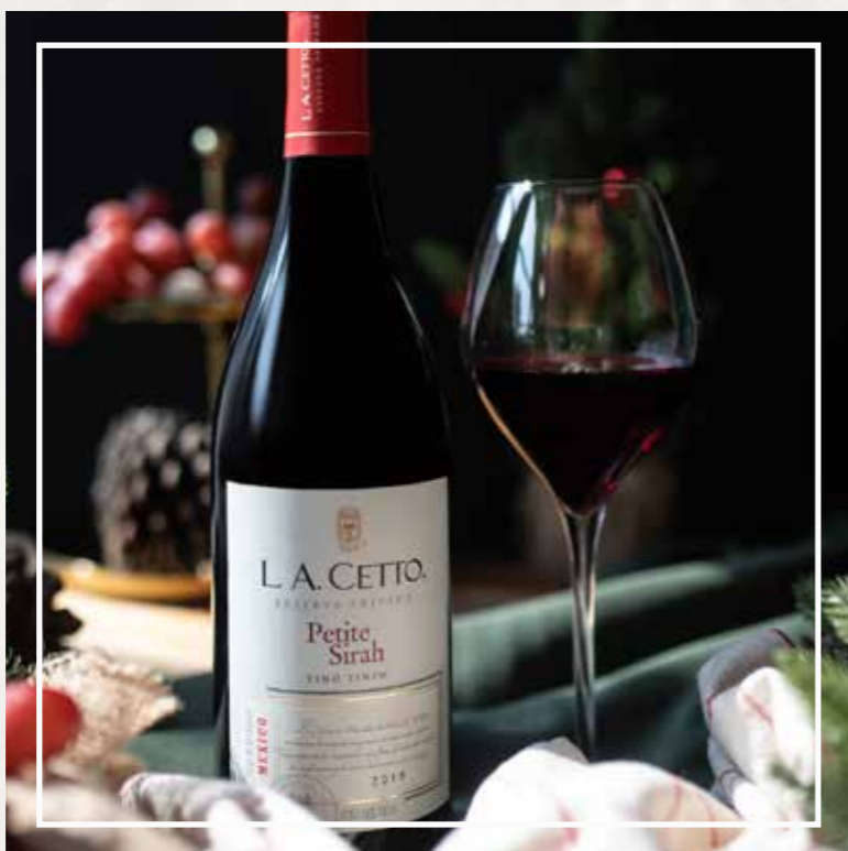
PETITE SIRAH RESERVA PRIVADA 2018