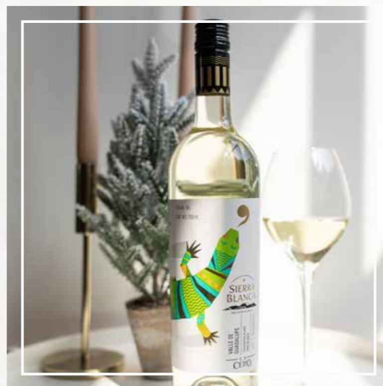
SIERRA BLANCA SAUVIGNON BLANC 2021