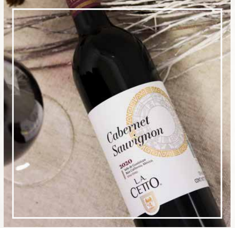
CABERNET SAUVIGNON LA CETTO 2020