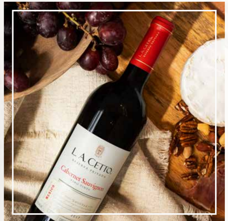
CABERNET SAUVIGNON RESERVA PRIVADA 2018