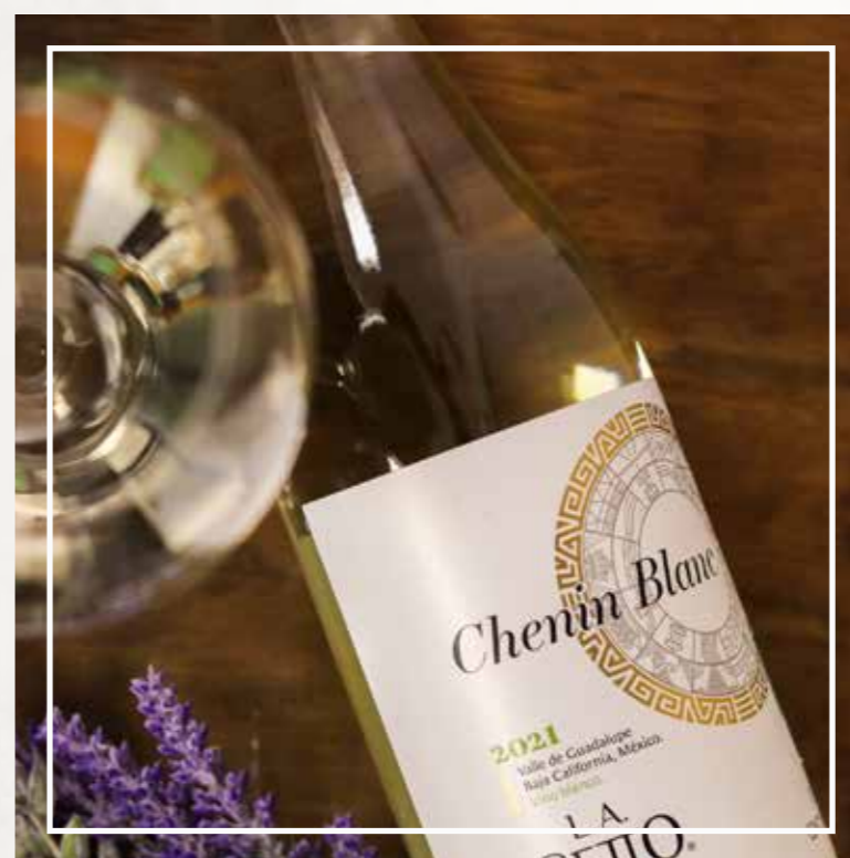
CHENIN BLANC LA CETTO 2021