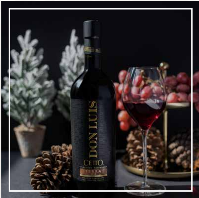
DON LUIS TERRA 2018