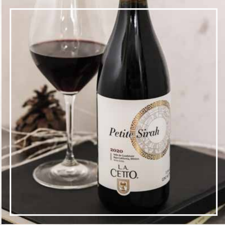
PETITE SIRAH LA CETTO 2020