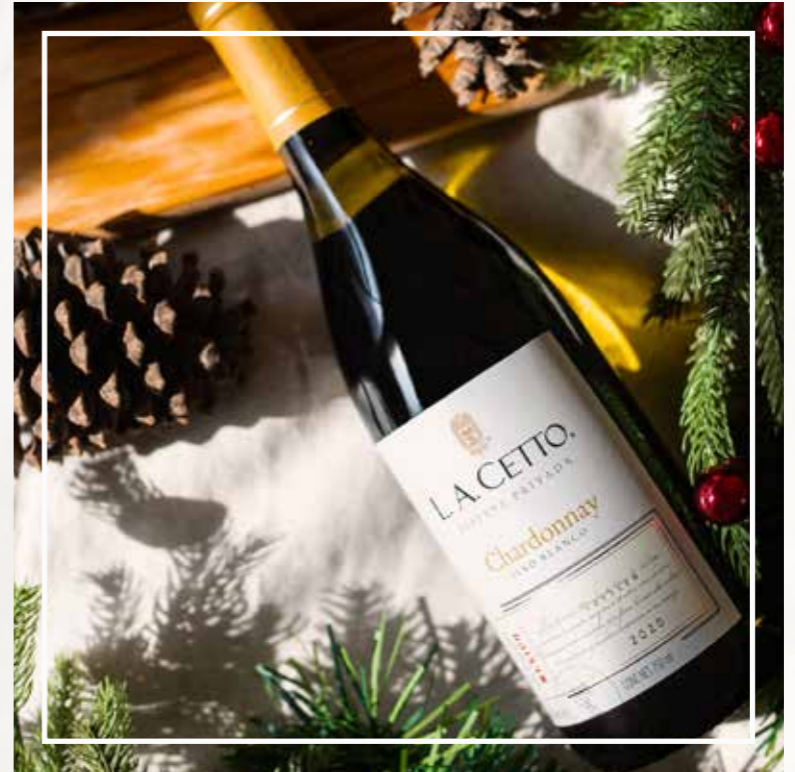
CHARDONNAY RESERVA PRIVADA 2020